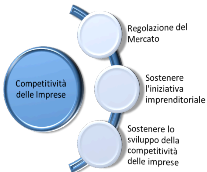
Figura 4 Area Strategica Competitività delle Imprese. CCIAA Messina