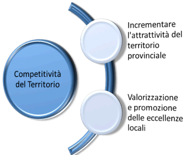
Figura 1 Area Strategica Competitività del Territorio - CCIAA Messina