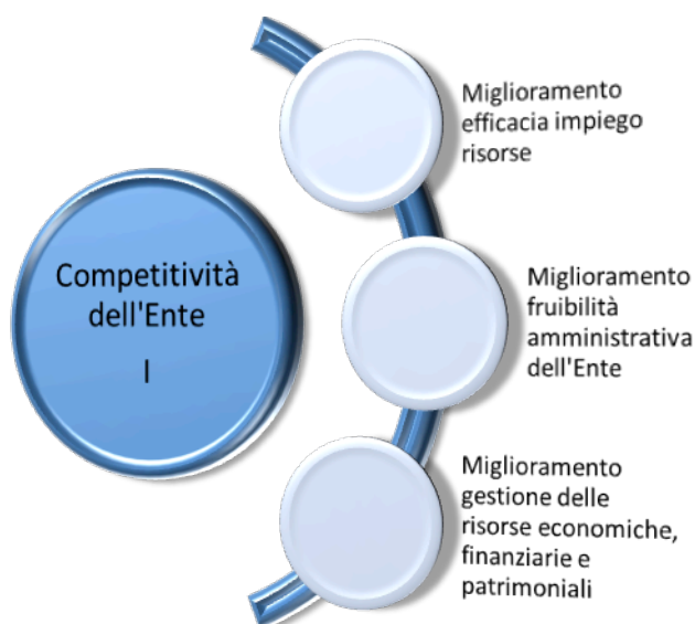
Figura 2 Area Strategica Competitività dell'Ente - CCIAA Messina. Parte I.