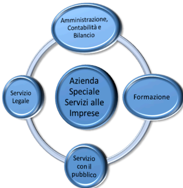
Figura 5 Obiettivi Strategici Azienda Speciale