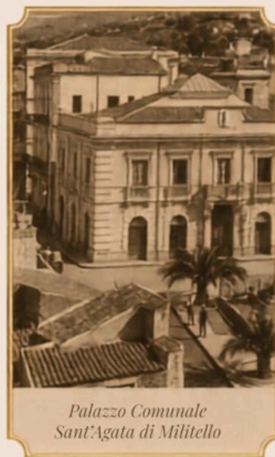
Palazzo Comunale Sant'Agata di Militello